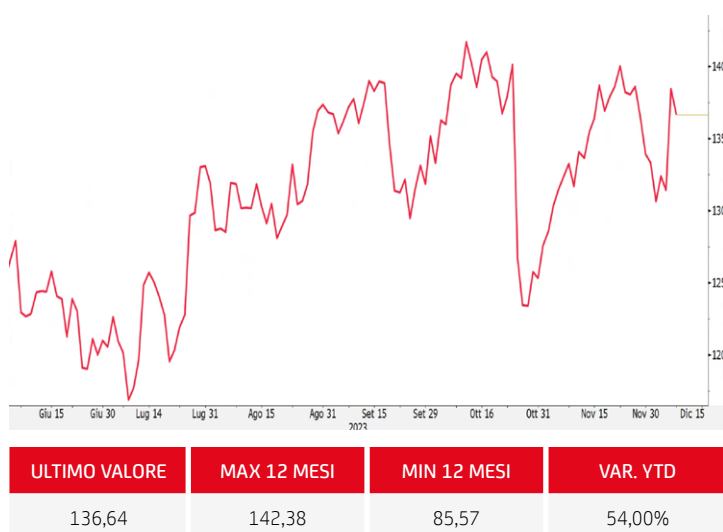
GRAFICO ALPHABET (C)

Fonte dati: Bloomberg, dati aggiornati alle 10:40 dell'11/12/2023